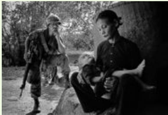
Philip Jones Griffiths/Quang Ngai, Vietnam del Sud, 1967. Courtesy Magnum Photos/Contrasto

"Questa è Guerra!" - Mostra fotografica in esposizione a Padova sino al 31 maggio prossimo - racconta 100 anni di conflitti, documentati dalle rare stereoscopie di inizio Novecento sino alle dettagliate foto satellitari del Ventunesimo secolo.