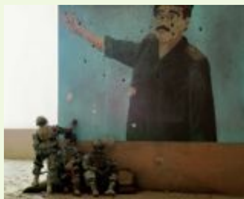
Paolo Ventura/Afghanistan, 2008. New York, collezione privata

Le ultime sale della mostra sono dedicate ai conflitti odierni dall'Afghanistan all'Ucraina