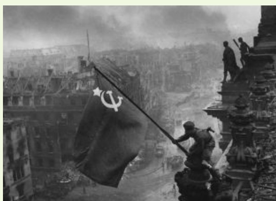
Evgenij Chaldej - La bandiera sovietica sventola sulle rovine del Reichstag alla fine della battaglia di Berlino. 2 maggio 1945. Courtesy Getty Images