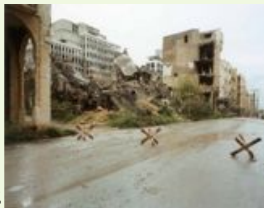
Gabriele Basilico/Beirut, 1991.