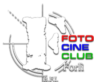
FOTO CINE CLUB FORLÌ