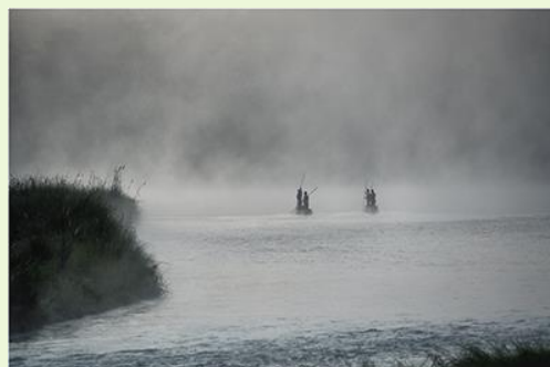
2° Classificato: Dervis Castellucci