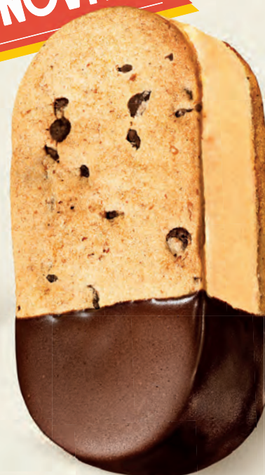
CAFFÈ & CACAO

Biscotto con gocce di cioccolato, gelato al caffè, variegatura al caffè e cacao, copertura al cacao.