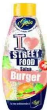
Cod. 7649 SALSA BURGER TWISTER GR. 800

Salsa ideale per hamburger, in formato twister.