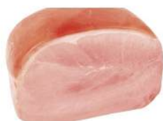
Cod. 7307 PROSCIUTTO COTTO BONSI META' - 4 KG. C.A

Prosciutto cotto scelto, forma tondeggiante con cotenna.