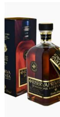
Cod. B012 GRAPPA RISERVA BARRICATA CL. 70

Al naso presenta un bouquet complesso ed elegante, con note di frutti rossi. In bocca si rivela piena, fragrante e morbida, caratterizzata da una grande struttura dovuta alle uve di provenienza.