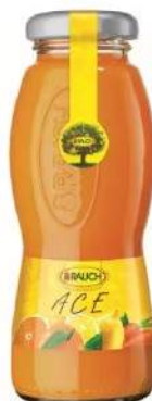
Cod. 7849 SUCCO ACE ML. 200 PZ. 24 Succo al gusto di ace.