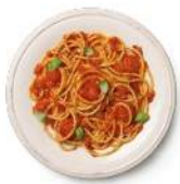
Cod. 8403 SPAGHETTI MED. POMODORO E BASILICO - GR. 300 PZ. 4

Pasta di semola di grano duro con salsa al pomodoro con pomodorini ciliegia e basilico.