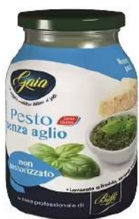
Cod. 7667 PESTO SENZ'AGLIO GR. 980