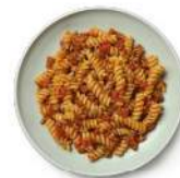
Cod. 8255 FUSILLI DI MAIS AL RAGU' SENZA GLUTINE - GR. 300 PZ. 4

Pasta di semola di grano duro con salsa al pomodoro.