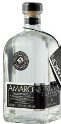
Cod. B011 GRAPPA RISERVA BIANCA CL. 70

La Aldo Bottega Barricata, grazie al sapiente invecchiamento in barrique di rovere, si caratterizza per il colore ambrato, il sapore pieno e i sentori speziati.