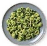
Cod. 8176 ORECCHIETTE CIME DI RAPA GR. 300 PZ. 4

Pasta di semola di grano duro con salsa alle cime di rapa. Precucinata e congelata.