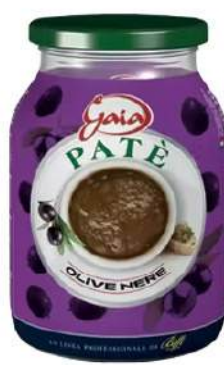
Cod. 7637 PATE' OLIVE NERE GR. 1000

Paté di olive nere in barattolo di vetro.