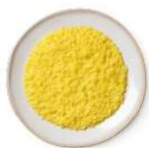
Cod. 8365 RISOTTO ZAFFERANO B. GR. 300 PZ. 4 Riso con zafferano.