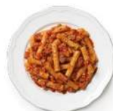
Cod. 8392 MACCHERONCINI SALSICCIA GR. 300 PZ. 4

Pasta di semola di grano duro con pecorino romano e pepe.