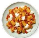
Cod. 8177 MEZZE MANICHE SORRENTINA GR. 300 PZ. 4

Pasta di semola di grano duro con salsa alle cime di rapa. Precucinata e congelata.