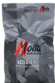
Cod. 7871 PROSCIUTTO COTTO SCUDIERO INT. - 8 KG. C.A

Prosciutto cotto, forma tondeggiante con cotenna, taglio a metà.