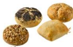
Cod. 4058 MINI DELIZIE MIX GR. 30 PZ. 120

GR. 80 PZ. 32 Gustoso come una focaccia, morbido e alveolato come un panino. Farina ai cereali.