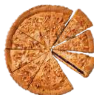
Cod. 6515 TORTA GRANO ANTICO, MORE, MANDOR. PRET. GR. 1500 PZ 12

Base di pasta frolla con farina di frumento, ripieno di ciliegie e polpa di ciliegie.