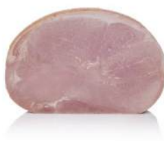
Cod. 7872 PROSCIUTTO COTTO SCUDIERO META' - 4 KG. C.A

Deliziosa coscia di suino, senza glutine e senza derivati del latte.