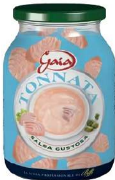
Cod. 7605 SALSA TONNATA GR. 960