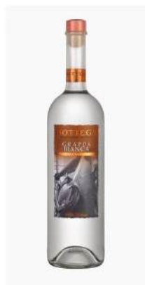
Cod. B009 ALDO BOTTEGA GRAPPA BIANCA L. 1

La Aldo Bottega è un distillato trasparente e cristallino che si caratterizza per la personalità e per l'intensità organolettica.