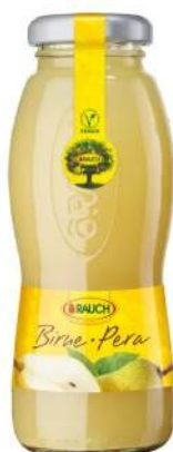
Cod. 7852 SUCCO PERA ML. 200 PZ. 24 Succo al gusto di pera.