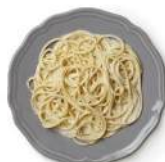
Cod. 8391 SPAGHETTI CACIO E PEPE B. GR. 300 PZ. 4

Pasta di semola di grano duro con salsa al pesto.