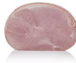
Cod. 7873 PROSCIUTTO COTTO LEONE D'ORO META' - 8 KG. C.A

Sfiziosa coscia di suino, senza glutine e senza derivati del latte.