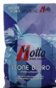
Cod. 7873 PROSCIUTTO COTTO LEONE D'ORO INT. - 8 KG. C.A

Deliziosa coscia di suino a metà, senza glutine e senza derivati del latte.