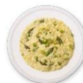
Cod. 8908 RISOTTO AGLI ASPARAGI B. GR. 300 PZ. 4 Riso precucinato e condito con salsa agli asparagi, congelato.