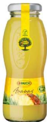
Cod. 7847 SUCCO ANANAS ML. 200 PZ. 24 Succo al gusto di ananas.