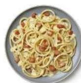
Cod. 8454 SPAGHETTI CHITARRA ALLA CARBONARA - GR. 300 PZ. 8

Pasta fresca all'uovo con ripieno a base di speck e brie.