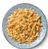
Cod. 8422 MEZZE PENNE AL SALMONE GR. 300 PZ. 4

Gnocchi di patate con formaggi e gorgonzola.