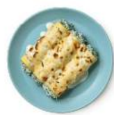
Cod. 8409 CANNELLONI RICOTTA E SPINACI - GR. 300 PZ. 4

Gnocchi di semola di grano duro agli spinaci con pesto rosso.