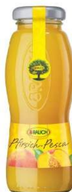
Cod. 7855 SUCCO PESCA ML. 200 PZ. 24 Succo al gusto di pesca.