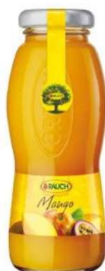
Cod. 7865 SUCCO MANGO ML. 200 PZ. 24 Succo al gusto di mango.