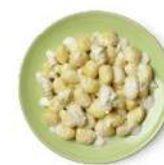
Cod. 8421 GNOCCHI AI FORMAGGI GR. 300 PZ. 4

Pasta all'uovo con funghi champignon e funghi porcini.