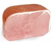
Cod. 7308 PROSCIUTTO COTTO DREAM INTERO - 8 KG. C.A

Prosciutto cotto, forma tondeggiante con cotenna, taglio a metà.