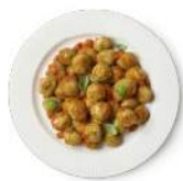
Cod. 8408 GNOCCHI VERDI CON PESTO GR. 300 PZ. 4

Pasta di semola di grano duro con pancetta affumicata, grana padano e pecorino toscano.