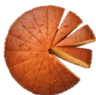
Cod. 6491 TORTA SOFFICE ALLO YOGURT GR. 1000 PZ 16

Semplice pasta frolla ripiena con golosa crema al cacao, decorata con gocce di cioccolato in superficie.