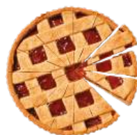
Cod. 6512 CROSTATA DI ALBICOCCHE PRET. - GR. 1000 PZ 16

Classico plum-cake allo yogurt guarnito con gocce di cioccolato.