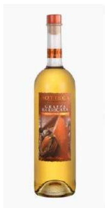
Cod. B010 ALDO BOTTEGA GRAPPA BARRICATA L. 1

La Aldo Bottega è un distillato trasparente e cristallino che si caratterizza per la personalità e per l'intensità organolettica.