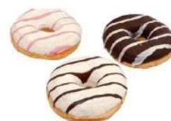
Cod. 1589 DOONY'S MISTI FARCITI GR. 72 PZ 36 Scatola mista di donuts farciti con golose creme in tre diverse varianti: lampone, crema pasticceria e cioccolato.