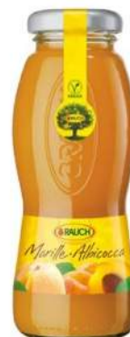
Cod. 7850 SUCCO ALBICOCCA ML. 200 PZ. 24 Succo al gusto di albicocca.