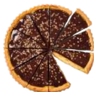
Cod. 6514 TORTA MAIS, PERE, CIOCC. PRET. - GR. 1200 PZ 12

Soffice torta con purea di carote, farina di mandorle e yogurt.