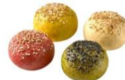
Cod. 4126 MINI BUN ARCOBALENO GR. 30 PZ. 100

Piccoli formati, mix di quattro panini mignon, perfetti per essere serviti durante i pasti e i buffet, in un ricco cestino del pane o pronti per essere farciti.