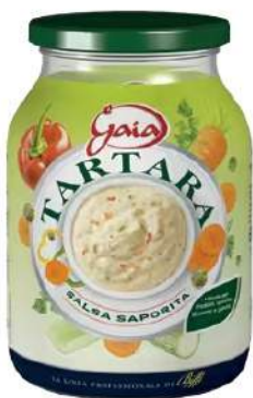
Cod. 7604 SALSA TARTARA GR. 960