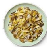
Cod. 8417 TAGLIATELLE AI FUNGHI GR. 300 PZ. 4

Pasta fresca all'uovo con ripieno a base di ricotta e spinaci con besciamella.