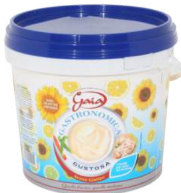
Cod. 7643 MAIONESE GAIA GUSTOSA GR. 5000

Salsa ideale per hamburger, in formato twister.