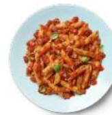
Cod. 8407 PENNETTE ALLA MATRICIANA GR. 300 PZ. 4

Pasta di semola di grano duro con pancetta affumicata, grana padano e pecorino toscano.