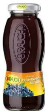
Cod. 7848 SUCCO MIRTILLO ML. 200 PZ. 24 Succo al gusto di mirtillo.