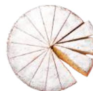
Cod. 6500 TORTA ALLE CAROTE PRET. GR. 1000 PZ 16

Tradizionale pasta frolla con farcitura di albicocca.