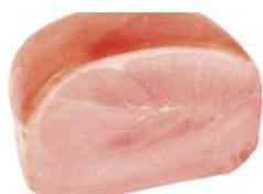
Cod. 7305 PROSCIUTTO COTTO BONSI INT. - 8 KG. C.A

Prosciutto cotto scelto, forma tondeggiante con cotenna.