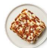
Cod. 8472 LASAGNE RICCHE EMILIANA GR. 350 PZ. 8

Pasta all'uovo con salsa alla pancetta, uova e pecorino romano.