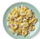
Cod. 8402 TORTELLINI PANNA E PROSCIUTTO - GR. 300 PZ. 8

Pasta di semola di grano duro con salsa di pomodoro e salsiccia in pezzi.