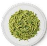
Cod. 8390 TROFIE AL PESTO GR. 300 PZ. 4

Pasta di mais e riso senza glutine con ragù di carne.