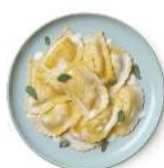
Cod. 8426 LUNETTE SPECK BRIE BURRO E SALVIA - GR. 300 PZ. 4

Pasta di semola di grano duro con salmone affumicato e salmone