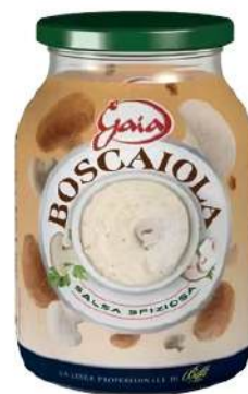
Cod. 7648 SALSA BOSCAIOLA GR. 960

Paté di olive nere in barattolo di vetro.