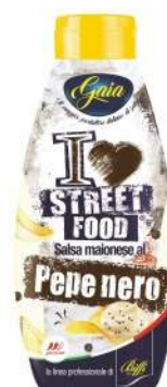
Cod. 7653 SALSA PEPE NERO TWISTER GR. 800

Salsa maionese al pepe nero, in formato twister.