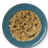
Cod. 8411 RISOTTO AI FUNGHI B. GR. 300 PZ. 4 Riso con funghi champignon e funghi porcini.