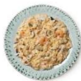
Cod. 8413 RISOTTO DI MARE B. GR. 300 PZ. 4 Riso con molluschi e crostacei.