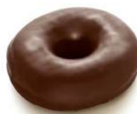
Cod. 1583 DOONY'S CIOCCOLATO GR. 55 PZ 36 Donut con copertura di vero cioccolato al latte belga e decorato con granella di cioccolato al latte.