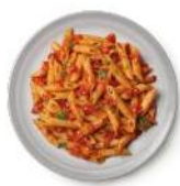
Cod. 8405 PENNETTE ALL'ARRABBIATA GR. 300 PZ. 8

Pasta di semola di grano duro con salsa al pomodoro con pomodorini ciliegia e basilico.