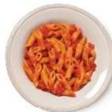
Cod. 8184 MEZZE PENNE POMODORO B. GR. 300 PZ. 4

Pasta di semola di grano duro con pomodoro e mozzarella. Precucinata e congelata.