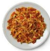
Cod. 8406 TAGLIATELLE BOLOGNESE GR. 300 PZ. 4

Pasta di semola di grano duro con polpa di pomodoro, cipolla e peperoncino.