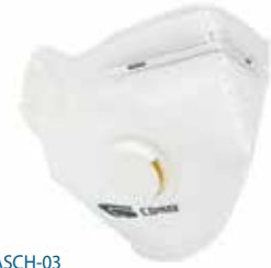
MASCH-03 • TIPO FFP1 • MASSIMO LIVELLO D'USO: 4 x TLV • CON VALVOLA DI ESALAZIONE