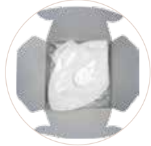
Mascherine blisterate singolarmente

TLV: Il valore limite di soglia di una sostanza chimica è un livello al quale si ritiene che un lavoratore possa essere esposto giorno dopo giorno per una vita lavorativa senza effetti negativi per la salute.