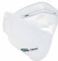
MASCH-04 • TIPO FFP2 • MASSIMO LIVELLO D'USO: 10 x TLV • SENZA VALVOLA DI ESALAZIONE