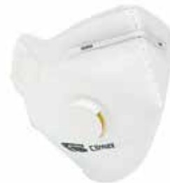
MASCH-06 • TIPO FFP3 • MASSIMO LIVELLO D'USO: 50 x TLV • CON VALVOLA DI ESALAZIONE

Le maschere autofiltranti offrono una protezione contro le particelle solide e liquide. Sono molto leggere, comode e offrono una resistenza molto bassa alla respirazione. Il clip e il pad interno consentono una perfetta vestibilità al viso dell'utilizzatore. Elastico senza lattice. Imballaggio ermetico individuale garanzia di igiene.