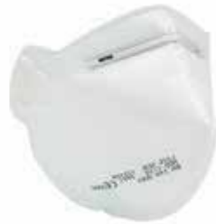
MASCH-01 • TIPO FFP1 • MASSIMO LIVELLO D'USO: 4 x TLV • SENZA VALVOLA DI ESALAZIONE

TLV: Il valore limite di soglia di una sostanza chimica è un livello al quale si ritiene che un lavoratore possa essere esposto giorno dopo giorno per una vita lavorativa senza effetti negativi per la salute.