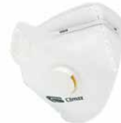
MASCH-05 • TIPO FFP2 • MASSIMO LIVELLO D'USO: 10 x TLV • CON VALVOLA DI ESALAZIONE