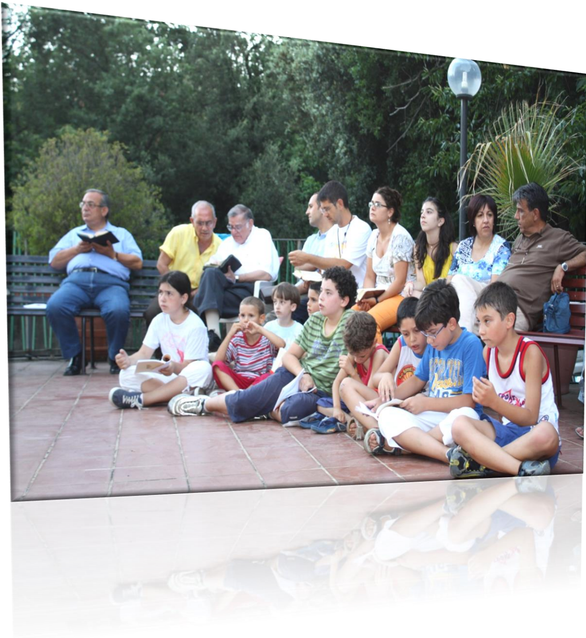
Figura 1: Celebrazione dei Vesperi assieme ai bambini