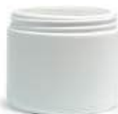
Barattolo a Vaso 500 ml (polietilene PE)