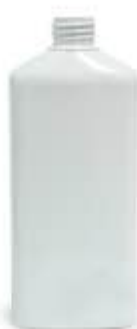
Bottiglia 1 lt (cloruro di polivinile PVC 3)