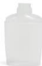
Flacone Opalino 150 ml (polietilene ad alta densità PE-HD 2)