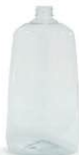
Bottiglia Ovale 1 lt (polietilene tereftalato PET)