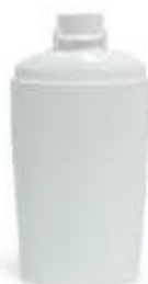
Flacone 200 ml (polietilene ad alta densità PE-HD 2)