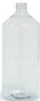
Bottiglia 1 lt (polietilene tereftalato PET)