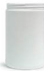
Barattolo a Vaso 1 lt (polietilene PE)