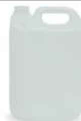
(polietilene ad alta densità PE-HD 2)