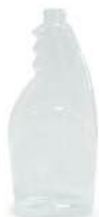
Flacone Spray 750 ml (polietilene tereftalato PET)