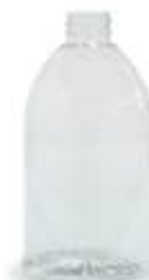
Bottiglia a Campana 500 ml (polietilene tereftalato PET)