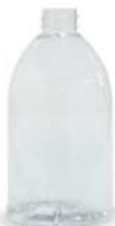
Bottiglia a Campana 1 lt (polietilene tereftalato PET)