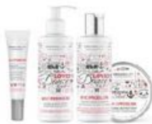
linea anti acne