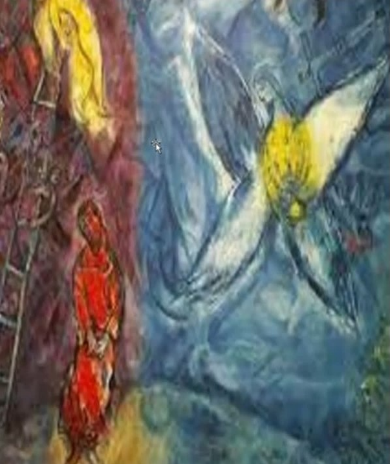
Nell'arte MARC CHAGALL