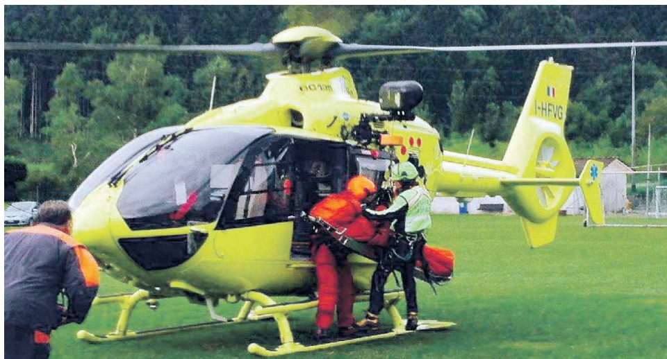
I SOCCORSI L'elicottero del 118 durante un intervento: ieri a Sacile l'equipe medico infermieristica è intervenuta per un malore in azienda