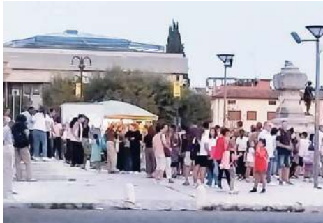
Le famiglie che hanno partecipato all'incontro in duomo

Erano presenti genitori e nonni con i loro figli e nipoti e pure qualche insegnante di scuola e catechista. C'erano i bambini che frequenteranno il catechismo in oratorio, ma anche persone da fuori parrocchia. La chiesa era gremi-