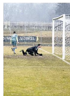
DILETTANTI Cresce la protesta contro la Riforma dello sport