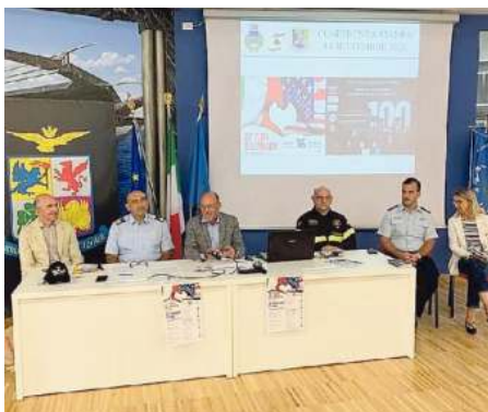
La presentazione della Festa dell'amicizia italo-americana

La manifestazione è domani con un epilogo domenica: la "Corsa del centenario", cui collabora l'Atletica Aviano, evento ospitato in trenta enti dell'Aeronautica in Italia in occasione dei cent'anni del corpo militare. I partecipanti alle due prove, una competitiva di 10 chilometri e l'altra, di 5, aperta a tutti, potranno cor-