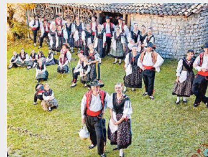
Da tutto il mondo per il tradizionale Festival del folklore

Dall'omaggio musicale al Premio Malattia della Vallata al Festival del folklore, dall'Estate a Pordenone a "Piancavallo bambina!" dedicato alle famiglie, anche oggi ci sono appuntamenti di ogni genere artistico nella Destra Tagliamento.