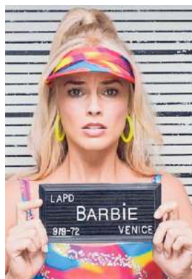
Margot Robbie è Barbie nel film dei record