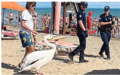
Il pellicano scappato dallo zoo di Lignano e arrivato a Bibione

La polizia municipale, che è stata subito avvertita, ha trasennato un'area della spiaggia per metterlo al riparo dal sole. «Nel frattempo – racconta Ma-