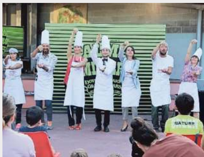
Il Microfestival partirà da Socchieve

Torna, con la sua settima edizione, Microfestival, la rassegna itinerante di arte performativa ideata da Puntozero società cooperativa e parte della rete culturale Intersezioni! Anche quest'anno il festival si svolgerà in modalità itinerante da venerdì alla vigilia di Ferragosto, attraverso quattro piccoli paesi della regione: Socchieve venerdì, Lusevera sabato, Prato Carnico domenica e Lauro lunedì 14. Le giornate di festival saranno organizzate tutte secondo la medesima scaletta: alle 16 si potrà partecipare a una passeggiata immersi nel fresco del bosco, accompagnati da una guida naturalistica di Wildroutaps. Alle 18.30 avrà inizio lo spettacolo ideato dagli artisti durante la loro residenza e a seguire si continuerà con musica e festa insieme. In programma anche due concerti collaterali, che anticiperanno la tournée, a Nova Gorica e Cormons, il 9 e 10 agosto.