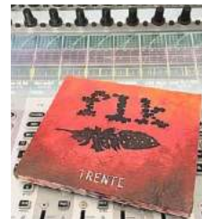
La copertina di "Trente"

Da "Ratatuie" a "Em-ma" sono ottanta minuti di suoni puliti, rotondi e maturi, esaltati dalla produzione di Stefano Amerio, in cui spiccano