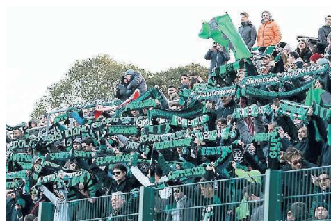
IL "MURO" NEROVERDE I tifosi del Pordenone allo stadio "Tognon" di Fontanafredda

Ore decisive per il Pordenone Calcio. Una volta ottenuta l'accettazione formale da parte degli ex tesserati (giocatori e tecnici) della proposta societaria per il recupero dell'85% dei compensi non percepiti da aprile in poi, dal punto di vista federale la società sarà in regola. Potrà quindi inoltrare al Consiglio federale nazionale la domanda per l'iscrizione in sovrannumero alla serie D o, in alternativa, all'Eccellenza. Sarebbe un'ottima "carta da visita" anche di fronte al Tribunale fallimentare, che il 21 agosto valuterà il cammino concordatario fatto in questi due mesi, poiché l'intera operazione si baserebbe su "soldi freschi".