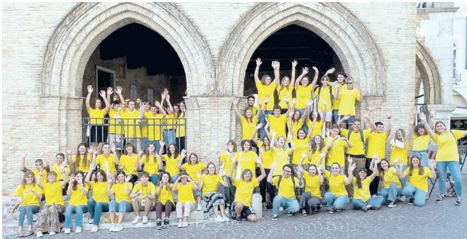
PRONTI A TORNARE IN PRIMA LINEA Gli Angeli radunati sotto il Municipio per una foto ricordo dopo aver affrontato gli incontri preparatori

SONO DI PORDENONE E DINTORNI, MA VENGONO ANCHE DA TRIESTE, TRAMONTI, DAL VENETO E UNA DI LORO RIENTRERÀ DA MILANO