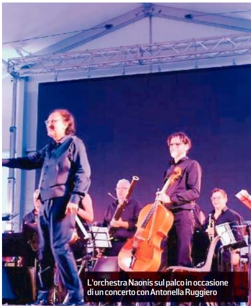
L'orchestra Naonis sul palco in occasione di un concerto con Antonella Ruggiero

Fra un giro e l'altro lungo lo Stivale, giovedì l'orchestra Naonis farà tappa a casa, a Pordenone, per la "Notte magica di San Lorenzo": alle 21 sul palco di piazza XX settembre, diretta da Alberto Pollesel, sarà impegnata nel concerto "Dal tramonto all'alba", con un programma di musiche composte da autori ispirati dalle misteriose ombre notturne, nel trascorrere dei sogni dall'o-