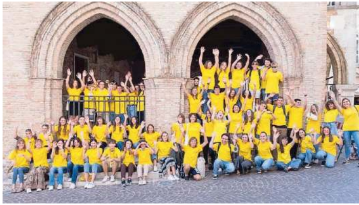
Alcuni degli angeli di Pordenonelegge: a settembre saranno 213 i volontari in servizio

Con il progetto "Un angelo per amico" che promuove la solidarietà intergenerazionale, viene favorita concretamente, la partecipazione di chi ha 80 anni. Per quanti, residenti a Pordenone e con pre-