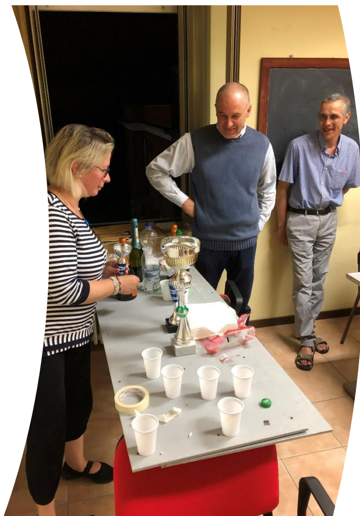
Il Presidente dell'Associazione Manera Scighera