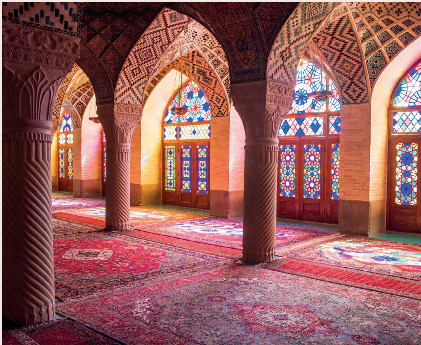
Moschea di Nasir al-Mulk, Shiraz

Un itinerario approfondito in una terra che accompagna la storia dell'umanità dai suoi albori e che custodisce tesori artistici e culturali di straordinaria bellezza.