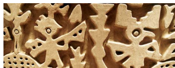
Particolare della cittadella di Chan Chan

Mattinata dedicata alla visita della città: la Plaza de Armas, la Cattedrale, il Museo Archeologico, il Tempio del Sole e della Luna e, nel pomeriggio, la cittadella di Chan Chan, antica capitale dell'impero Chimù. Visita a Huanchaco e trasferimento in aeroporto. All'arrivo a Lima, assistenza e trasferimento all'hotel prescelto.