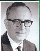
MARIANO RUMOR 2 MANDATI (IV-V) 1973 - 1974