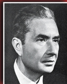
ALDO MORO 3 MANDATI (I-II-III) 1963 - 1968