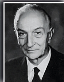
ANTONIO SEGNI 1 MANDATO (I) 1955 - 1957