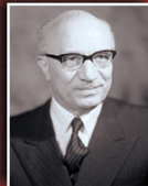
AMINTORE FANFANI 1 MANDATO (VI) 1987 - 1987