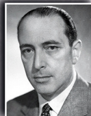
FERNANDO TAMBRONI 1 MANDATO 1960 - 1960