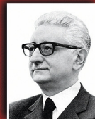
GIOVANNI LEONE 1 MANDATO (I) 1963 - 1963