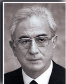
FRANCESCO COSSIGA 2 MANDATI (I-II) 1979 - 1980