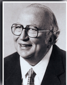
GIOVANNI SPADOLINI 2 MANDATI (I-II) 1981 - 1982