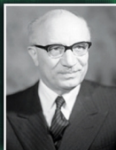
AMINTORE FANFANI 1 MANDATO (I) 1954 - 1954