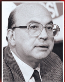
BETTINO CRAXI 2 MANDATI (I-II) 1983 - 1987