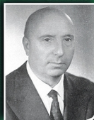
MARIO SCELBA 1 MANDATO 1954 - 1955