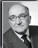
ADONE ZOLI 1 MANDATO 1957 - 1958