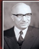
AMINTORE FANFANI 1 MANDATO (V) 1982 - 1983