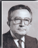
GIULIO ANDREOTTI 3 MANDATI (III-IV-V) 1976 - 1979