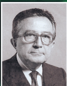
GIULIO ANDREOTTI 2 MANDATI (I-II) 1972 - 1973