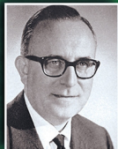
MARIANO RUMOR 3 MANDATI (I-II-III) 1968 - 1970