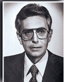
ARNALDO FORLANI 1 MANDATO 1980 - 1981