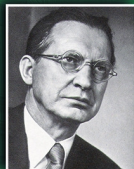
ALCIDE DE GASPERI 7 MANDATI (II-VIII) 1946 - 1953