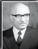
AMINTORE FANFANI 1 MANDATO (II) 1958 - 1959