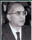
EMILIO COLOMBO 1 MANDATO 1970 - 1972