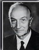
ANTONIO SEGNI 1 MANDATO (II) 1959 - 1960