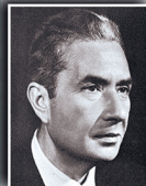
ALDO MORO 2 MANDATI (IV-V) 1974 - 1976