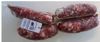
Salamini File da 4 - kg.0,5ca €/kg.30,00