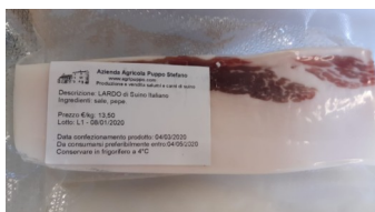
Lardo Confezione da kg.0,30 ca €/kg.15,00