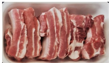
Costine conf. da kg.0,70a €/kg.9,90