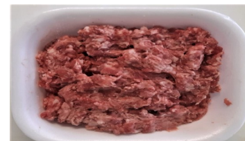
Macinata scelta conf. da kg.0,5ca €/kg.9,50