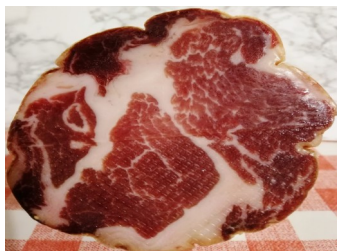
Coppa Confezione da kg.0,80 ca €/kg.25,00