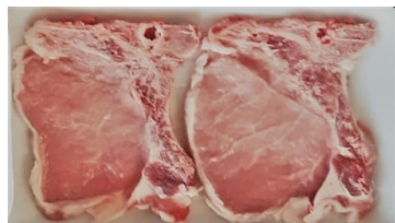
Braciole Conf. da 2 kg.0,40ca €/kg.9,90