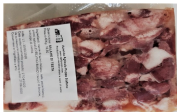
Salame di testa Confezione da kg.0,25 ca €/kg.19,50

TUTTI i nostri salumi sono ottenuti solo dalla carne dei suini che alleviamo, macelliamo, trasformiamo e stagioniamo in Azienda.