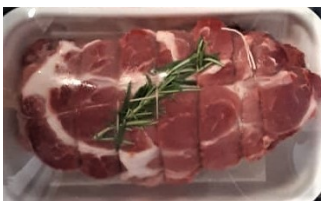
Arrosto di coppa conf. Kg.1,00 ca €/kg.13,50