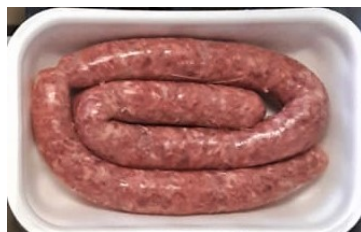
Salsiccia Confezione da kg.0,50 ca €/kg.10,90