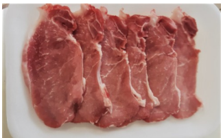
Lonza a fettine conf. da 6 kg.0,40ca €/kg.16,00