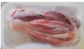
Stinco kg.1,00 ca €/kg.9,50