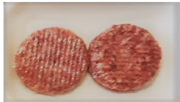
Hamburger conf. da 2 kg.0,2ca €/kg.13,00