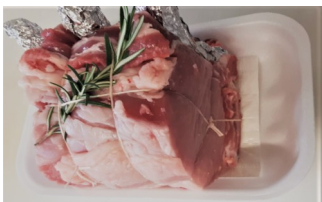
Arista con osso conf. da kg.1,80 ca €/kg.11,50