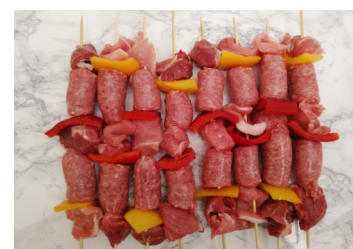
Spiedini Kg.0,60ca €/kg.15,50

Consegnamo a: Pavia - Voghera (PV) - Segrate (MI) - Cernusco s.N. (MI) - Cassina de' Pecchi (MI) - Brugherio (MI) - Gessate (MI) - Melzo (MI)