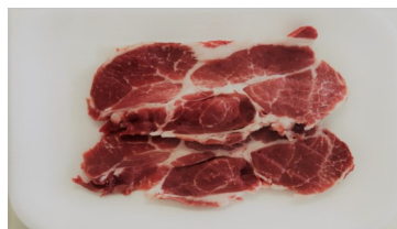
Bistecche di coppa conf. da 2 kg.0,20ca €/kg.13,50