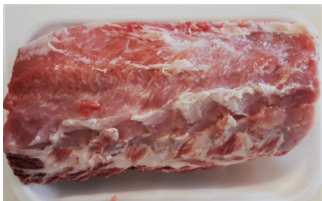
Lonza per arrosto conf da kg.1,00ca €/kg.13,50