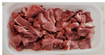
Spezzatino Kg.0,60ca €/kg.10,90