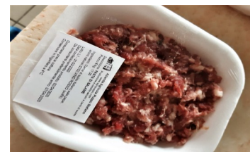
Pasta di salame conf. da kg.0,5ca €/kg.18,00