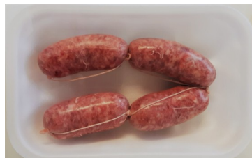
Salamelle Confezione da kg.0,40 ca €/kg.10,90