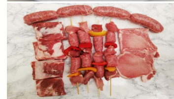
Grigliata:1 bracio- la,2 spiedini,1 sa- lamella,2costine €/cad.15,00