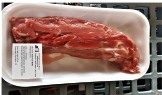
Filetto conf. kg.0,70 ca €/kg.16,90