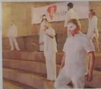
Alcuni momenti della manifestazione I Love Pulcherada che, dopo 5 anni, è tornata a incantare la città