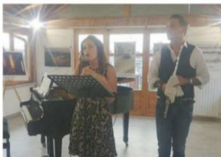
UN MOMENTO della manifestazione di sabato

Ha avuto così inizio la sua passione che l'ha condotta fino a curare la sua prima personale. "A giugno abbiamo organiz-