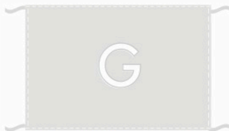
Orlo perimetrale semplice con lacci nei quattro angoli