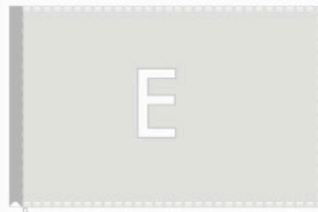
Doppio orlo perimetrale con asola tubolare piatta 4 cm. lato sinistro