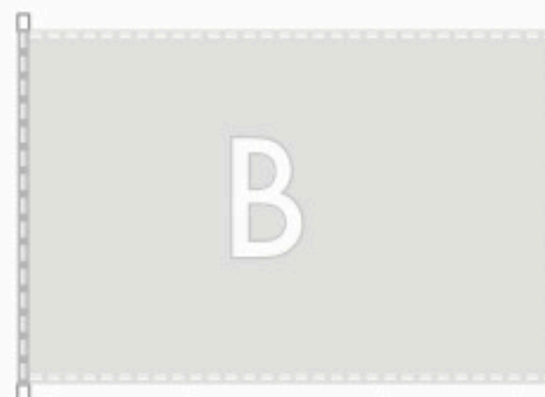
Doppio orlo perimetrale con tela e mezzi anelli lato sinistro