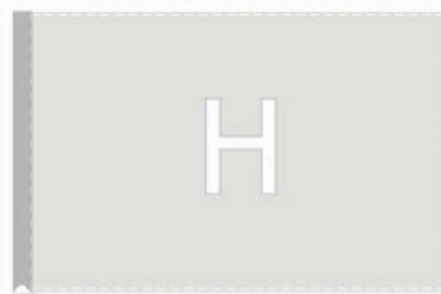
Orlo perimetrale semplice con asola tubolare piatta 4 cm. lato sinistro