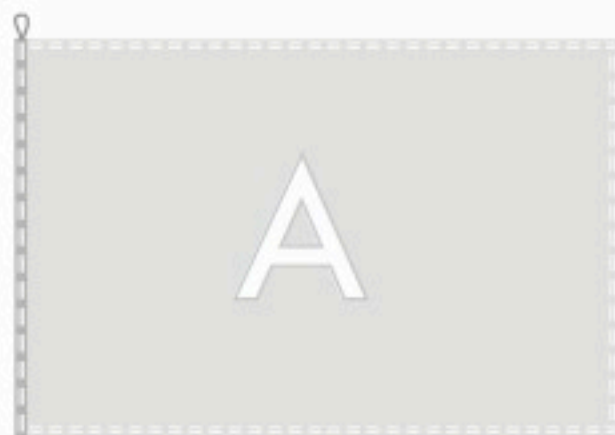
Doppio orlo perimetrale con tela e corda lato sinistro