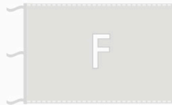
Doppio orlo perimetrale con lacci cuciti lato sinistro