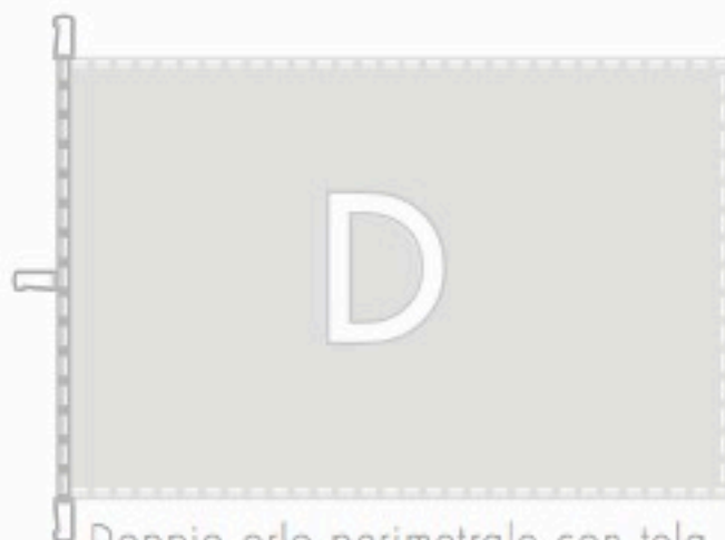
Doppio orlo perimetrale con tela e tre moschettoni lato sinistro