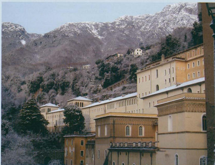
Al mattino del 14 febbraio la Badia si ritrova sotto un leggero manto di neve