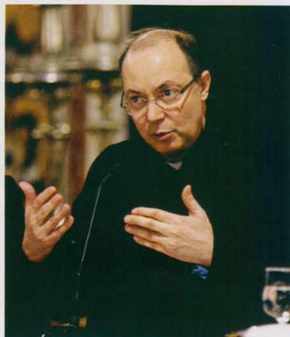
Mons. Marco Frisina

Mons. Marco Frisina, direttore del coro della diocesi di Roma, ben noto al grande pubblico per le sue composizioni di musica sacra, ha trattato da specialista un tema che della spiritualità è la cifra. Se la musica è estrinsecazione massima dello spirito nella sua universalità di espressione, la musica sacra è esigenza precipua del culto cristiano di lode a Dio. La Bibbia ne è tutta pervasa, sin dall'Esodo che rende in termini di inno il fatto storico della liberazione dall'Egitto, per culminare nei Salmi che sono la forma del pregare Dio secondo l'indicazione di Dio stesso. Forma fatta propria dalla Chiesa che modula tutta la sua preghiera sulle parole dei Salmi. Ed è proprio in un Salmo, il 47, che si coglie un'indicazione decisiva per la corretta interpretazione della forma: psallite sapienter , "cantate con arte", secondo la traduzione oggi più accreditata. Dunque l'arte assunta a misura della lode da tributare a Dio, ove l'avverbio sapienter , synetòs nella traduzione greca dei Settanta, va nel senso di "cantare con intelligenza". Intelligenza tuttavia che non si esaurisce in "un'idea razionalistica e di comprensibilità", ma che esprime piuttosto un cantare "in un modo degno dello Spirito e conforme a Lui, pieno di disciplina e purezza", secondo la felice esegesi di J. Ratzinger. Allo stesso modo, il verbo stesso psallein , scelto nel testo greco per tradurre l'ebraico zamir , rinvia all'uso di fare musica con uno strumento a