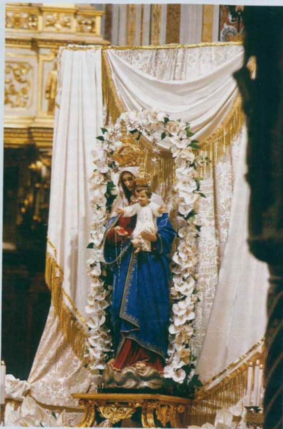
La statua della Madonna Avvocata l'8 dicembre è stata esposta nella Cattedrale della Badia