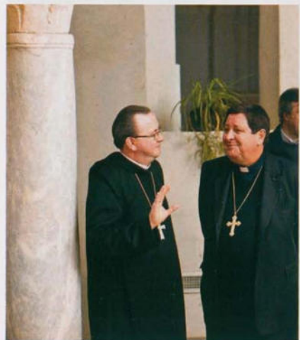
Il Cardinale, con il P. Abate, compie una fugace visita ai tesori della Badia