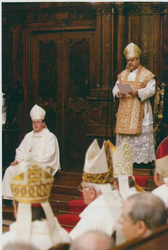
Il Cardinale pronuncia l'omelia

Secondo il sacerdote Paul Guillaume, storico dell'abbazia nel secolo XIX, appartenevano all'ordine cavense almeno 77 abbazie, 100 priorati, 20 monasteri, 10 obbedienze, 273 chiese. Ma, col passare del tempo e per cause a tutti note, l'Abbazia di Cava, come altri monasteri, ha vis-