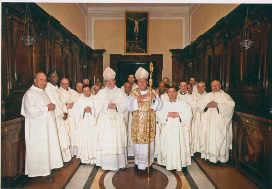
Il gruppo dei sacerdoti concelebranti appena rientrati in sagrestia