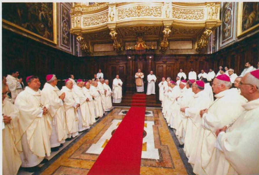
Durante la celebrazione il presbitero è animato da numerosi Prelati e sacerdoti

Anche l'Abbazia di Cava, oggi, dismesse tante altre preoccupazioni, può far tesoro della sua storia millenaria per essere sempre di più luogo di spiritualità benedettina e di preghiera, cenobio pronto ad accogliere quanti desiderano incontrare e ascoltare il Signore nella solitudine e nel silenzio. Quanti, soprattutto sacerdoti e giovani, oggi vanno alla ricerca di un'oasi dove sentire la voce del Signore e raddrizzare i sentieri del loro vivere; anime bisognose di confessioni, di colloqui spirituali, di pace interiore.