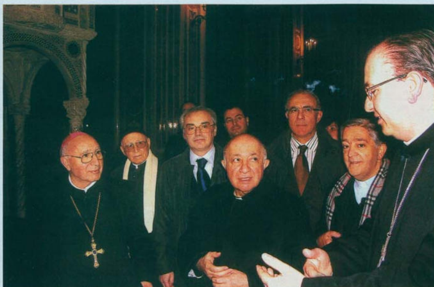
Il cardinale Dionigi Tettamanzi, ospite della Badia il 29 novembre, ammira la "straordinaria bellezza" della Cattedrale