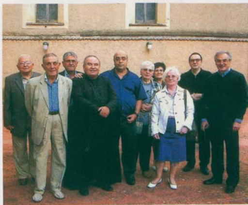
Oblato partecipanti al ritiro spirituale del 10-11 settembre

In occasione del millennio della Badia, quest'anno don Leone, per noi oblato, sta presentando il profilo dei Santi Padri Cavensi. Sono dodici di cui quattro santi e otto beati. La Santa Sede, con decreto del papa Leone XIII del 23 dicembre 1893 ha dichiarato santi: Alferio (1011-1050), Leone di Lucca (1050-1079), Pietro I (1079-1122) e Costabile (1122-1124) e con decreto del papa Pio XI del 16 maggio 1928 sono dichiarati beati Simeone, Falcone,