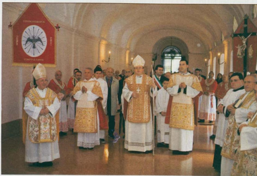
Un momento della celebrazione del 21 novembre

Il P. Abate e la Comunità monastica augurano buon Natale e felice anno nuovo agli ex alunni e alle loro famiglie e a tutti i lettori di "Ascolta"