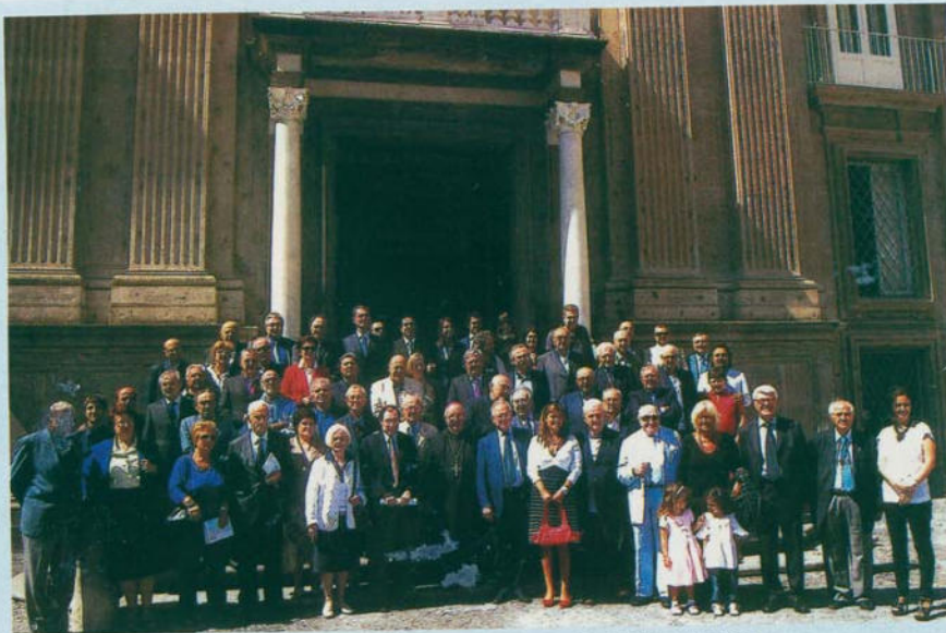
Gruppo di ex alunni al convegno annuale del 12 settembre