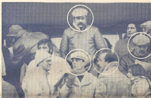
Gli spettatori racchiusi nel cerchietto incominciando dal signore in alto al centro vince un kg. di bocconcini offerti da Campeggia Armando; il 1. a sinistra vince una pizza e una birra offerti dal Ristorante - Pizzeria "da Vincenzo" - Viale Garibaldi, il 2. (di spalle) vince un dolce offerto dalla Pasticceria F.lli Senatore - Via V. Veneto il 3. vince un biglietto di tribuna scoperta per l'incontro di calcio Cavese-Ternana da ritirare presso il Bar Mena - Cava dei Tirreni.