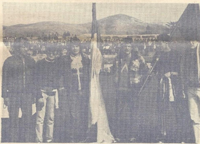
Casertana - Cavese 0-1: Il gemellaggio delle tifoserie prima della partita

Si sta svolgendo a Siano il IV Trofeo di Calcio Categoria Allievi. Partecipano le squadre del Napoli, Lazio, Bari, Cavese, Roma, Avellino, Ascoli, Sianese. Sabato 6 Aprile dalle 16,30 sono in programma le finali.