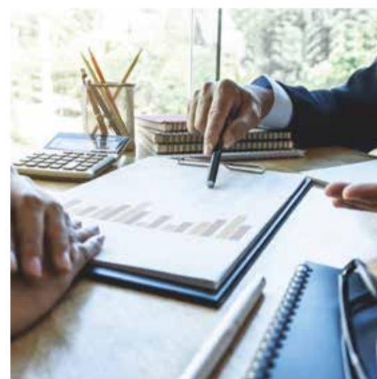
Certificazioni ambiente e qualità

STL CONSULTING S.R.L. P.IVA 10013201214 PBX +39 081 177 66 971 FAX..936 - SDI: KRRH6B9 Via Nazionale, 718 - Torre del Greco, 80059 (NA)