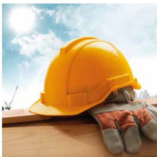
Centro di formazione sicurezza sul lavoro