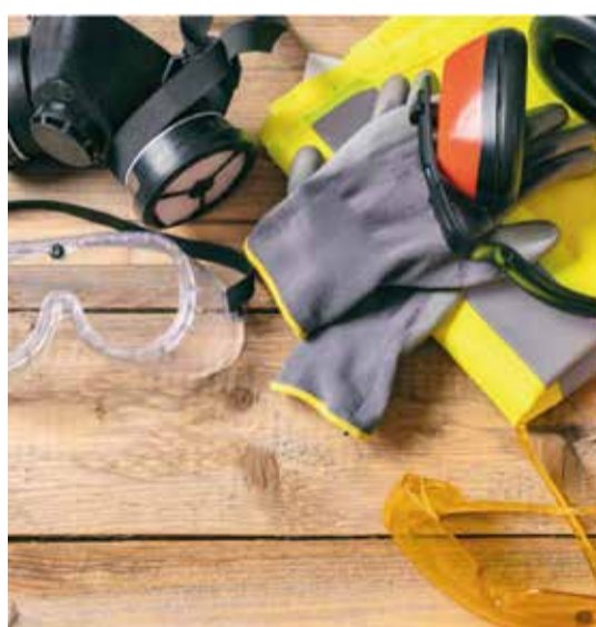
Sicurezza sul lavoro