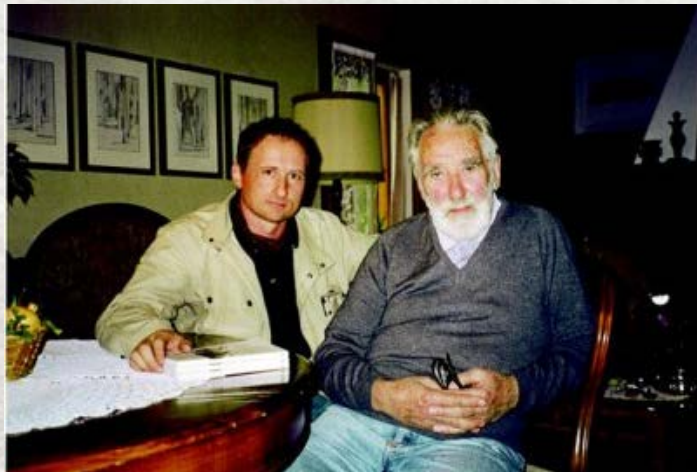
Con Mario Rigoni Stern ad Asiago, dicembre