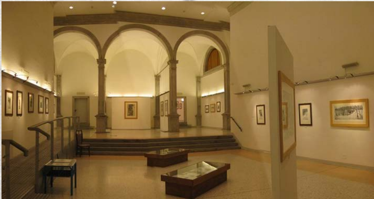
Visione d'insieme dello spazio espositivo