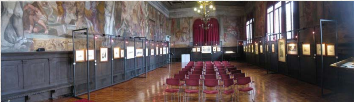
La Sala della Gran Guardia con le opere esposte

Esibizione del maestro Riccardo Favero in occasione dell'inaugurazione il 27 aprile 2012 >