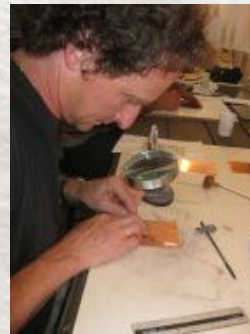
Intervento con bulino su matrice di rame