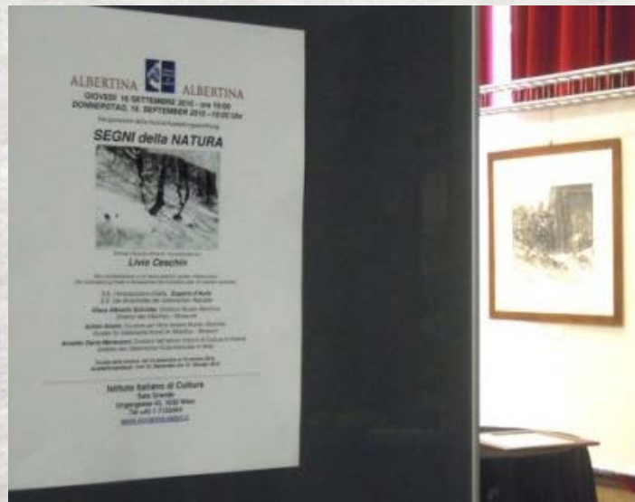
Ingresso all'esposizione con locandina