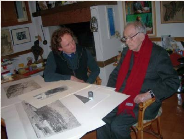
Con Andrea Zanzotto a Pieve di Soligo, dicembre