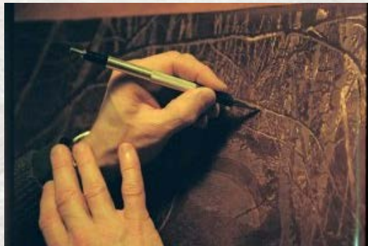
Intervento a puntasecca su matrice