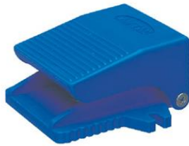
Valvola di fondo, pedale pneumatico