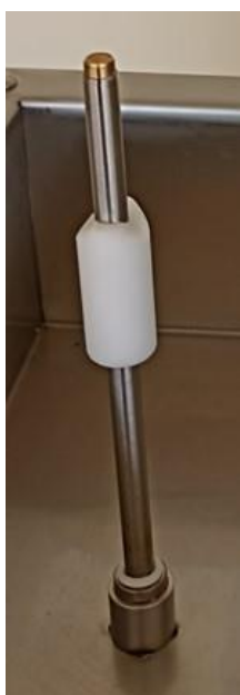
ugello o iniettore in acciaio inox

-La bombola di azoto con il suo regolatore non sono incluse-