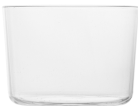
5062 - Natural 23 cl

23 cl al bordo - 20 cl a servizio Ø Superiore 8 - h 6 SAN Scatola da 54 pz