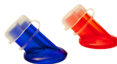
9007 - Tappo antipolvere Tappo per beccuccio Speed Bottles Sacchetto da 100 pz