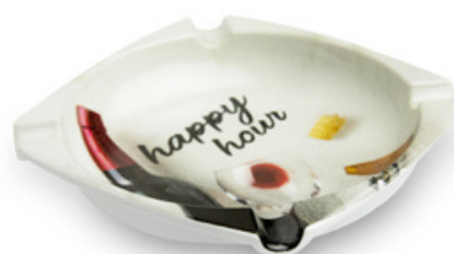
Personalizzabili Gli articoli in melamina sono prodotti su richiesta