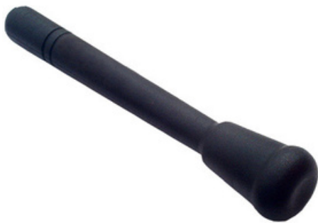
2000 - Pestello nero senza punte Lunghezza: 210 mm Ø pestello: 35 mm 20 pz /scatola