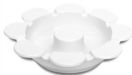
9032 - Margherita nero Ø 149 mm 107 grammi Altezza 34 mm