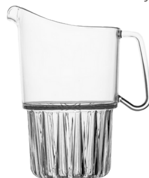
5064 - Caraffa Fancy

1,5 lt SAN Scatola da 6 pz 12,8X17,9Xh21