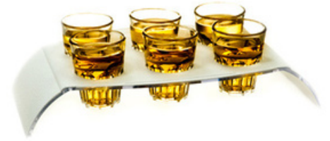
9006 - Vassoio per 6 bicchieri Shot

117mm x 68mm x H 52 mm 1 pz/sacchetto 50 pz /scatola