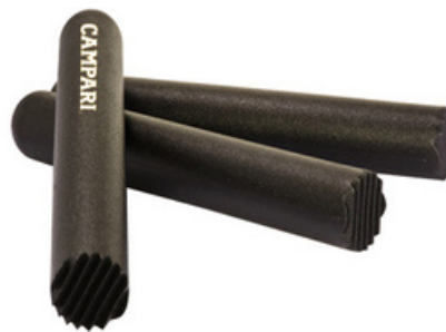
2006 - Pestello Pak con punte Lunghezza: 185 mm Ø pestello: 27mm 20 pz /scatola