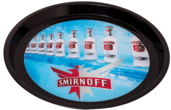
Vassoio Caffè- Gloss 320 mm x H 25 mm