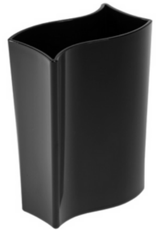
9018 - Vasetto (portagrissini, vaso decorativo) - Nero "Waves"