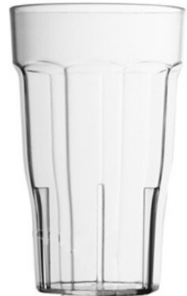
5000 - Mix trasparente - SAN

Capacità al bordo: 29 cl Capacità al servizio: 25/27 cl Diametro superiore: 83 mm Diametro inferiore: 53 mm Altezza: 100 mm Scatola da 280 pz o 140 pz