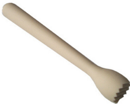
2005 - Pestello beige con punte Lunghezza: 215mm Ø pestello: 26 mm 20 pz/scatola