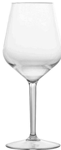
5056 - Sunrise 33 cl

Ø Base 8,1 - Ø Superiore 5,7 - h 19,7 Policarbonato Scatola da 6 pz