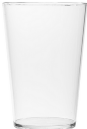
5044 - Conic 30 trasparente - SAN

Capacità al bordo: 49 cl Capacità al servizio: 40 cl Diametro superiore: 87 mm Diametro inferiore: 60 mm Altezza: 145 mm Scatola da 196 pz