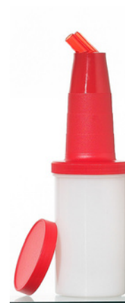
6000 - R Speed Bottle Rossa H: 25 cm Ø 8 cm Capacità: 1 lt 12 pz /scatola