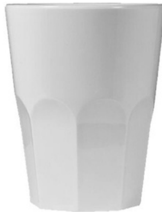
5037 - Rox bianco - SAN

Capacità al bordo: 29 cl Capacità al servizio: 25/27 cl Diametro superiore: 83 mm Diametro inferiore: 53 mm Altezza: 100 mm Scatola da 280 pz o 140 pz