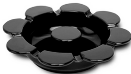
9031 - Margherita nero Ø 149 mm 107 grammi Altezza 34 mm