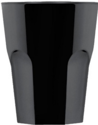
5036 - Rox nero - SAN

Capacità al bordo: 29 cl Capacità al servizio: 25/27 cl Diametro superiore: 83 mm Diametro inferiore: 53 mm Altezza: 100 mm Scatola da 350 pz o 140 pz