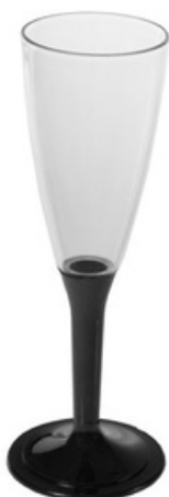
5045N - Fast Flute gambo nero

Capacità al bordo: 33 cl Capacità al servizio: 25 cl Diametro superiore: 82 mm Diametro inferiore: 58 mm Altezza: 95 mm - Peso 43 gr Scatola da 315 pz