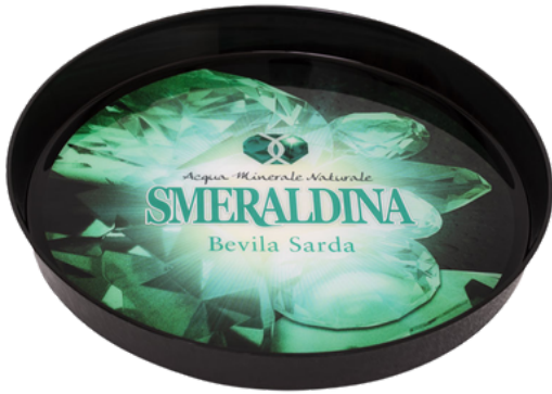
Vassoio Pub - Gloss 320 mm x H 40mm