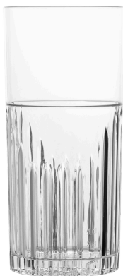
5060 - Barbados 42 cl

42 cl al bordo - 35-37 cl a servizio Ø Superiore 6,9 - Ø inferiore 6,8 - h 15 SAN Scatola da 24 pz