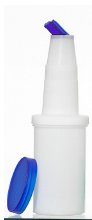
6000 - N Speed Bottle Neutra H: 25 cm Ø 8 cm Capacità: 1 lt 12 pz /scatola