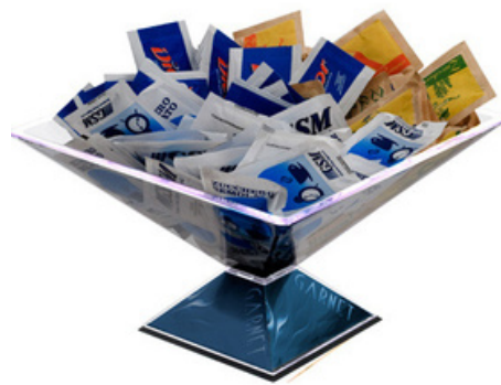
9005 - Portazucchero da banco "Louvre"

H: 225 mm - L: 115 mm Base: 100 x 100 mm Senza grafica - Reso anche smontato - Il pezzo smontato dà la possibilità di poter inserire il proprio logo