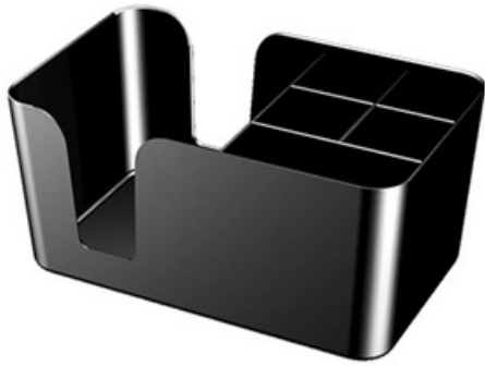
8000 - Bar Caddy Nero 10,7cm x 24cm x 15cm Tovaglioli: 25 x 25 Capienza: 200 tovaglioli 20 pz /scatola