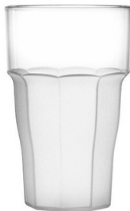
5039 - New York Trasp/satin - SAN

RIUTILIZZABILI LAVABILI IN LAVASTOVIGLIE TRASPARENTI COME IL VETRO PERSONALIZZABILI