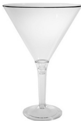
5050T - Fast Coppa gambo trasp.

Capacità al bordo: 10 cl Capacità al servizio: 8 cl Diametro superiore: 52 mm Coppetta Diametro inferiore: 60 mm Base Altezza: 170 mm Altezza Totale Scatola da 250 pz - Reso smontato