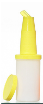
6000 - G Speed Bottle Gialla H: 25 cm Ø 8 cm Capacità: 1 lt 12 pz /scatola