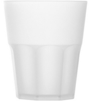
5026 - Rox frost - PP

Capacità al bordo: 29 cl Capacità al servizio: 25/27 cl Diametro superiore: 83 mm Diametro inferiore: 53 mm Altezza: 100 mm Scatola da 280 pz o 140 pz