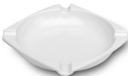
9034 - Square bianco 104x104 mm 53 grammi Altezza 18 mm