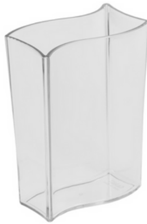
9017 - Vasetto (portagrissini, vaso decorativo) - Trasparente "Waves"