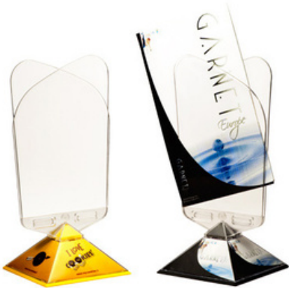
9010 - Portamenù/Porta Leaf- let "Wings"

H: 225 mm - L: 115 mm Base: 100 x 100 mm Senza grafica - Reso anche smontato - Il pezzo smontato dà la possibilità di poter inserire il proprio logo