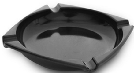
9033 - Square nero 104x104 mm 53 grammi Altezza 18 mm