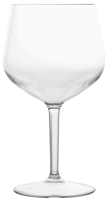
5054 - Tonic 75 cl

Ø Base 11,4 - Ø Superiore 9,2 - h 20,5 Tritan Scatola da 6 pz