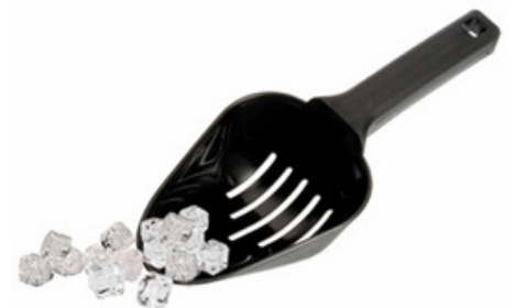
2010 - Paletta per ghiaccio H: 280 mm L: 110 mm 1 pz/sacchetto