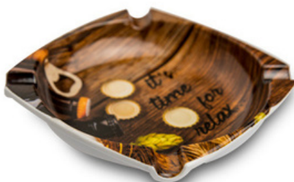
Square con logo 104x104 mm 53 grammi Altezza 18 mm