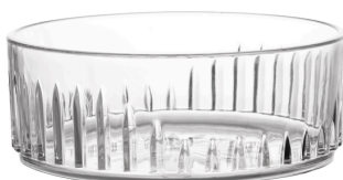
5063 - Chips

23 cl al bordo - 20 cl a servizio Ø Superiore 8 - h 6 SAN Scatola da 54 pz