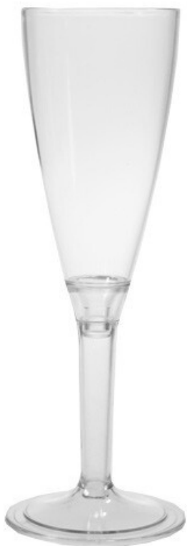
5045T - Fast Flute gambo trasparente

Capacità al bordo: 10 cl Capacità al servizio: 8 cl Diametro superiore: 52 mm Coppetta Diametro inferiore: 60 mm Base Altezza: 170 mm Altezza Totale Scatola da 250 pz - Reso smontato