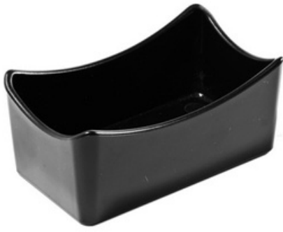
9001 - Porta zucchero "Armony" - Nero

117mm x 68mm x H 52 mm 1 pz/sacchetto 50 pz /scatola