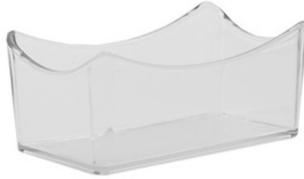
9003 - Porta zucchero "Armony"- Trasparente

117mm x 68mm x H 52 mm 1 pz/sacchetto 50 pz /scatola