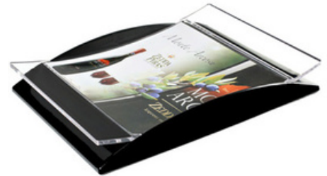
9004 - Rendiresto "Sinergy"

H: 123 mm - L: 200 mm - Base: 100 x 100 mm Senza grafica - Resa anche smontata - Il pezzo smontato dà la possibilità di poter inserire il proprio logo