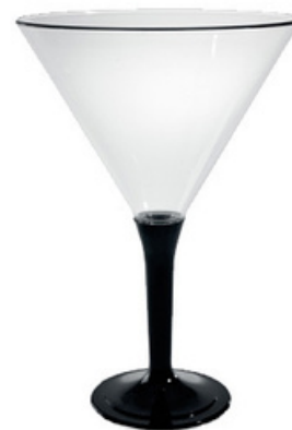
5050N - Fast Coppa gambo nero

Capacità al bordo: 29 cl Capacità al servizio: 20 cl Diametro superiore: 110 mm coppa Diametro inferiore: 60 mm base Scatola da 250 pz - Reso smontato