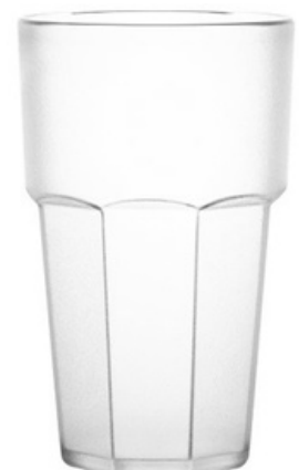
5031 - Expo satinato - SAN

Capacità al bordo: 35 cl Capacità al servizio: 30 cl Diametro superiore: 80 mm Diametro inferiore: 55 mm Altezza: 125 mm Scatola da 245 pz