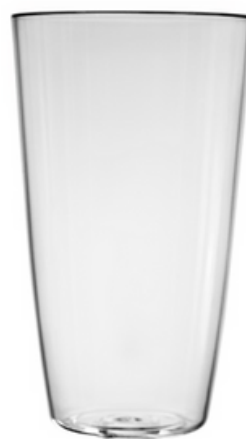
5052 - Pinta trasparente - SAN

Capacità al bordo: 35 cl Capacità al servizio: 30 cl Diametro superiore: 77 mm Diametro inferiore: 60 mm Altezza: 120 mm Scatola da 210 pz