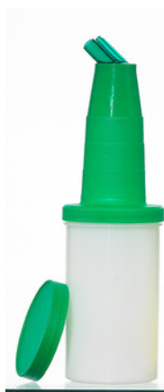
6000 - V Speed Bottle Verde H: 25 cm Ø 8 cm Capacità: 1 lt 12 pz /scatola