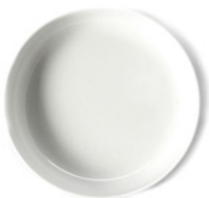
9039 - Piatto fondo Alba Ø 190 mm 141 grammi Altezza 33 mm