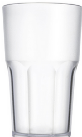
5032 - Granity 30 satinato - SAN

Capacità al bordo: 35 cl Capacità al servizio: 30 cl Diametro superiore: 77 mm Diametro inferiore: 60 mm Altezza: 120 mm Scatola da 210 pz