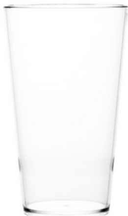
5024 - Conic 40 trasparente - SAN

Capacità al bordo: 75 cl Capacità al servizio: 57 cl Diametro superiore: ø 94 mm Diametro inferiore: ø 65 mm Altezza: 163 mm Scatola da 192 pz