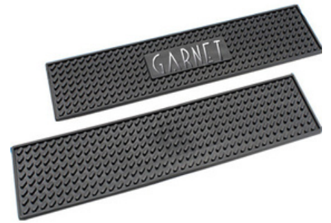
3001 - Bar mat doppio "Easy Mat" 58.8 cm x 13 cm x H 8mm 12 pz /scatola