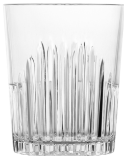
5059 - Aruba 40 cl

40 cl al bordo 33-35 cl a servizio Ø Superiore 8,5 - Ø inferiore 7 - h 10 SAN Scatola da 24 pz