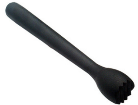
2003 - Pestello nero con punte Lunghezza: 215 mm Ø pestello: 26 mm 20 pz /scatola