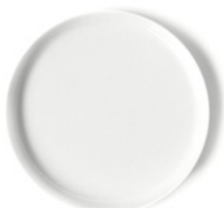
9040 - Piatto piano Alba Ø 227 mm 152 grammi Altezza 19 mm