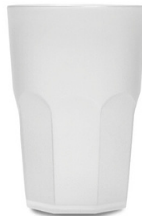
5043 - Easy Line Frost - PP

Capacità al bordo: 33 cl Capacità al servizio: 25 cl Diametro superiore: 82 mm Diametro inferiore: 58 mm Altezza: 95 mm Peso 53 gr Scatola da 224 pz