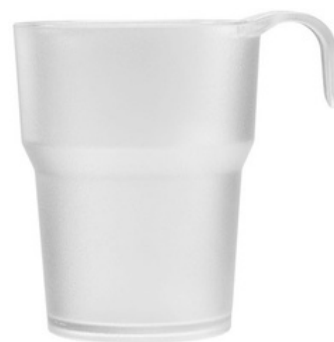
5042 - Tazza satinata - SAN

Capacità al bordo: 25 cl Capacità al servizio: 20 c Diametro superiore: 72 mm Diametro inferiore: 50 mm Altezza: 100 mm Scatola da 192 pz