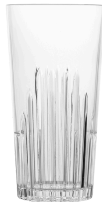
5061 - Bahamas 48 cl

48 cl al bordo - 40 cl a servizio Ø Superiore 6,5 - Ø inferiore 6 - h 15,5 SAN Scatola da 24 pz