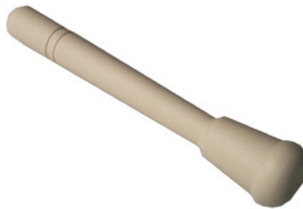
2002 - Pestello beige senza punte Lunghezza: 210 mm Ø pestello: 35 mm 20 pz/scatola