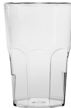
5046- Easy Line trasparente - SAN

Ø Base 6,2 - Ø Superiore 6,2 h 20 SAN Scatola da 24 pz