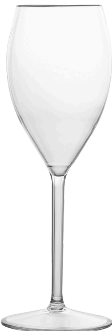
5057 - Blanco 26 cl

Ø Base 9 - Ø Superiore 6,5 - h 20,5 Tritan Scatola da 6 pz