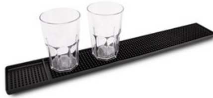
3000 - Bar mat 57.7 cm x 8.5 cm x H 1.5 cm 12 pz /scatola