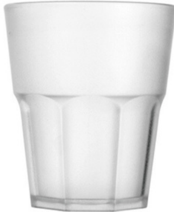
5021 - Rox satinato - SAN

Capacità al bordo: 29 cl Capacità al servizio: 25/27 cl Diametro superiore: 83 mm Diametro inferiore: 53 mm Altezza: 100 mm Scatola da 280 pz o 140 pz