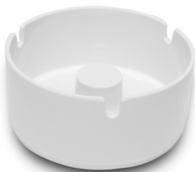
9036 - Luna bianco Ø 100 mm 81 grammi Altezza 45 mm