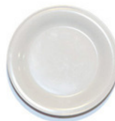
9044 - Piatto piccolo Tramonto Ø 194 mm 148 grammi Altezza 20 mm