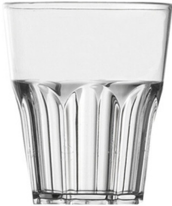
5015 - Rox trasparente - SAN

Capacità al bordo: 29 cl Capacità al servizio: 25/27 cl Diametro superiore: 83 mm Diametro inferiore: 53 mm Altezza: 100 mm Scatola da 280 pz o 140 pz