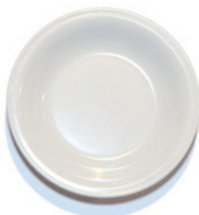
9042 - Piatto fondo Tramonto Ø 220 mm 230 grammi Altezza 35 mm