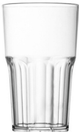
5033 - Granity 30 trasparente - SAN

Capacità al bordo: 35 cl Capacità al servizio: 30 cl Diametro superiore: 77 mm Diametro inferiore: 60 mm Altezza: 120 mm Scatola da 210 pz