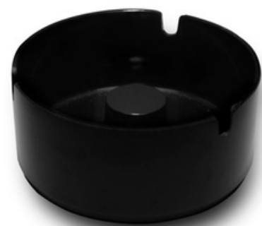
9035 - Luna nero Ø 100 mm 81 grammi Altezza 45 mm