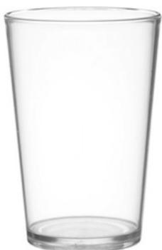
5029 - Akua trasparente - SAN

Capacità al bordo: 30 cl Capacità al servizio: 20 cl Diametro superiore: 73 mm Diametro inferiore: 47 mm Altezza: 135 mm Scatola da 320 pz o 160 pz