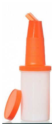
6000 - A Speed Bottle Arancione H: 25 cm Ø 8 cm Capacità: 1 lt 12 pz /scatola