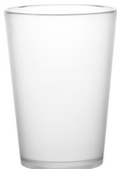
5030 - Akua satinata - SAN

Capacità al bordo: 25 cl Capacità al servizio: 20 cl Diametro superiore: 72 mm Diametro inferiore: 50 mm Altezza: 100 mm Scatola da 192 pz