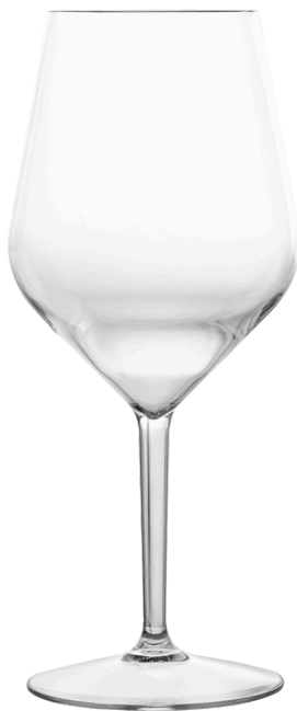
5055 - Sunrise 47 cl

Ø Base 9 - Ø Superiore 6,3 - h 21,5 Policarbonato Scatola da 6 pz