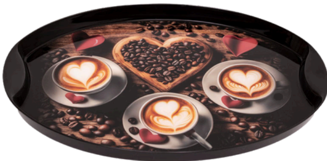
Vassoio BIG Smart - Gloss 420 mm x 300 mm x H 30 m