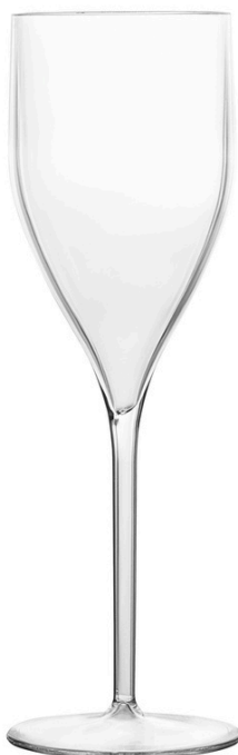
5058 - Festival 18 cl

Ø Base 6,2 - Ø Superiore 6,2 h 20 SAN Scatola da 24 pz